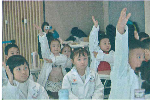
2019年11月16日 “陆地领主”活动