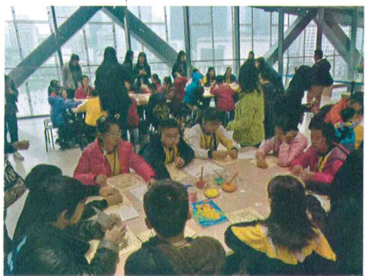
2017年-2019年 香港小学学生团体来馆参加成都历史文化专题研学活动