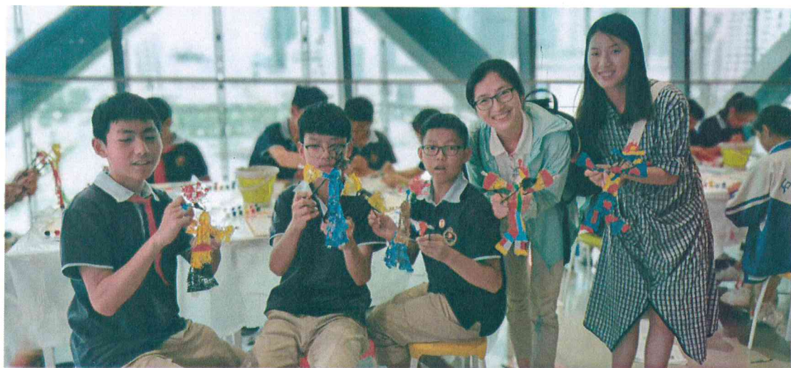
2019年 皮影敷彩——皮影主题学生团队研学活动