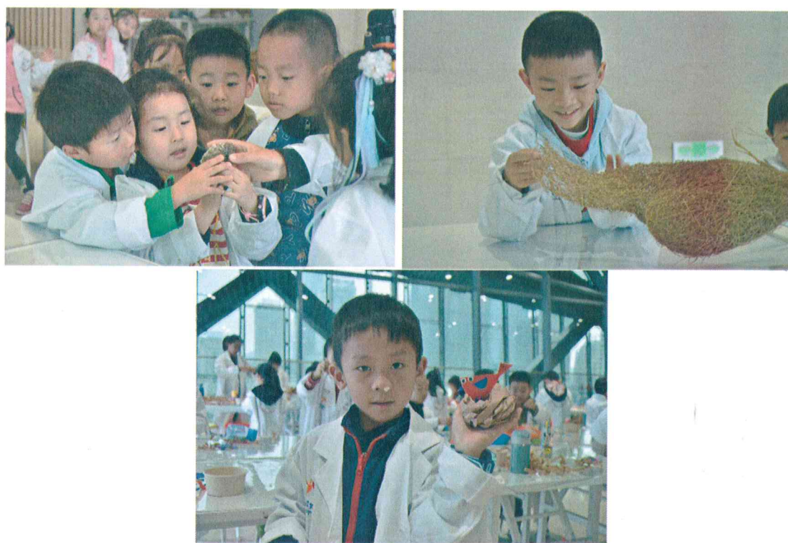
2019年11月9日 “动物界的建筑师”活动