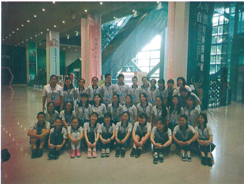
2019年8月12日“熊猫之声”2019成都（国际）童声合唱周期间 接待马来西亚代表团来馆参观