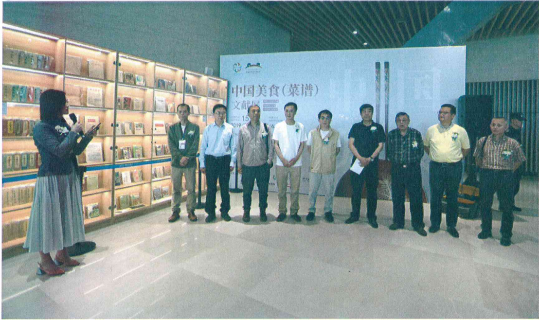
2019年5月15日 “中国美食(菜谱)文献展”