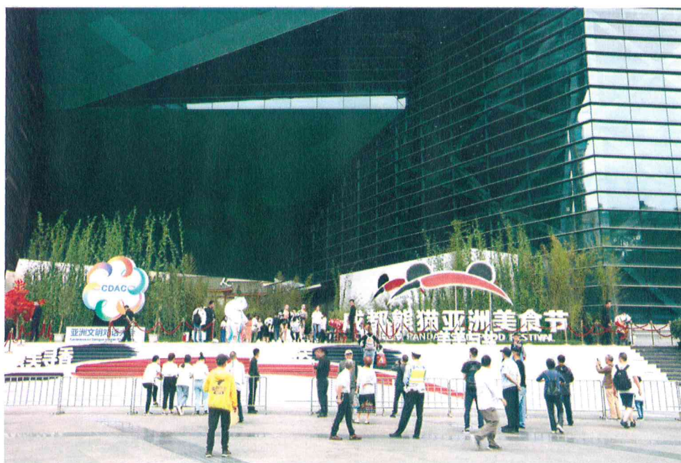
2019年5月16日 成都熊猫亚洲美食节开幕式现场

（五）具体承接“成都熊猫亚洲美食节”开幕式、“食为天—餐桌上的文化之旅”展览，以及中国美食菜谱文献展、国际美食摄影展、美食云视听佳片展播、新加坡娘惹文化周等相关活动，推动亚洲多元文明对话，发展天府文化，为成都“三城三都”建设作出重要努力。