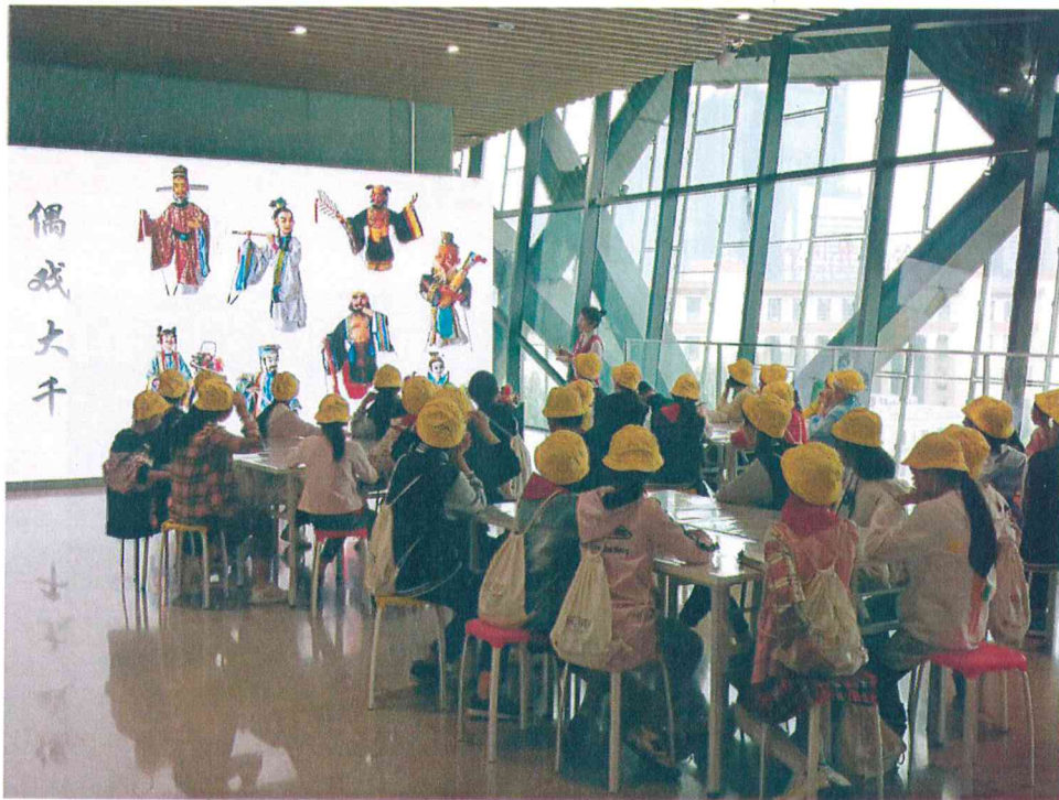
2019年 偶戏大千·中国木偶——木偶主题学生团队研学活动