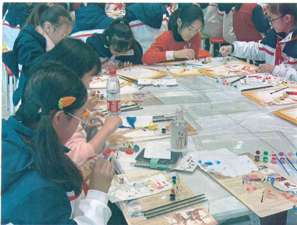
2019年 皮影敷彩——皮影主题学生团队研学活动