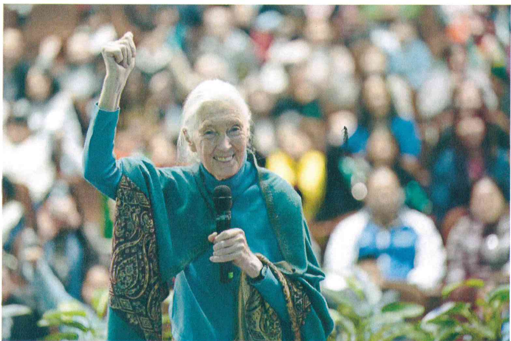
2019年11月15日 《人与自然：和谐与未来》讲座