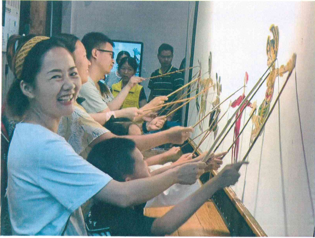
2019年 观众在成都博物馆参加皮影操纵体验活动