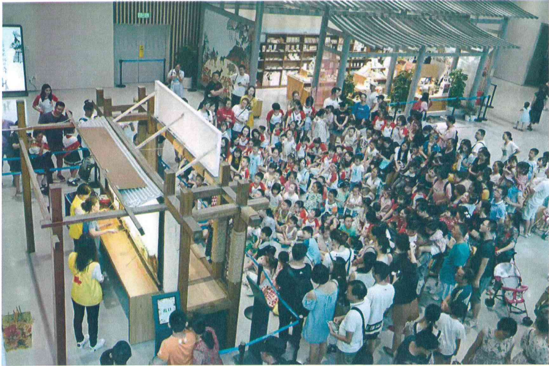
2019年 观众在成都博物馆观看皮影戏