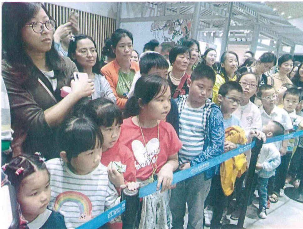
2019年 观众在成都博物馆排队等候参加皮影操纵体验活动