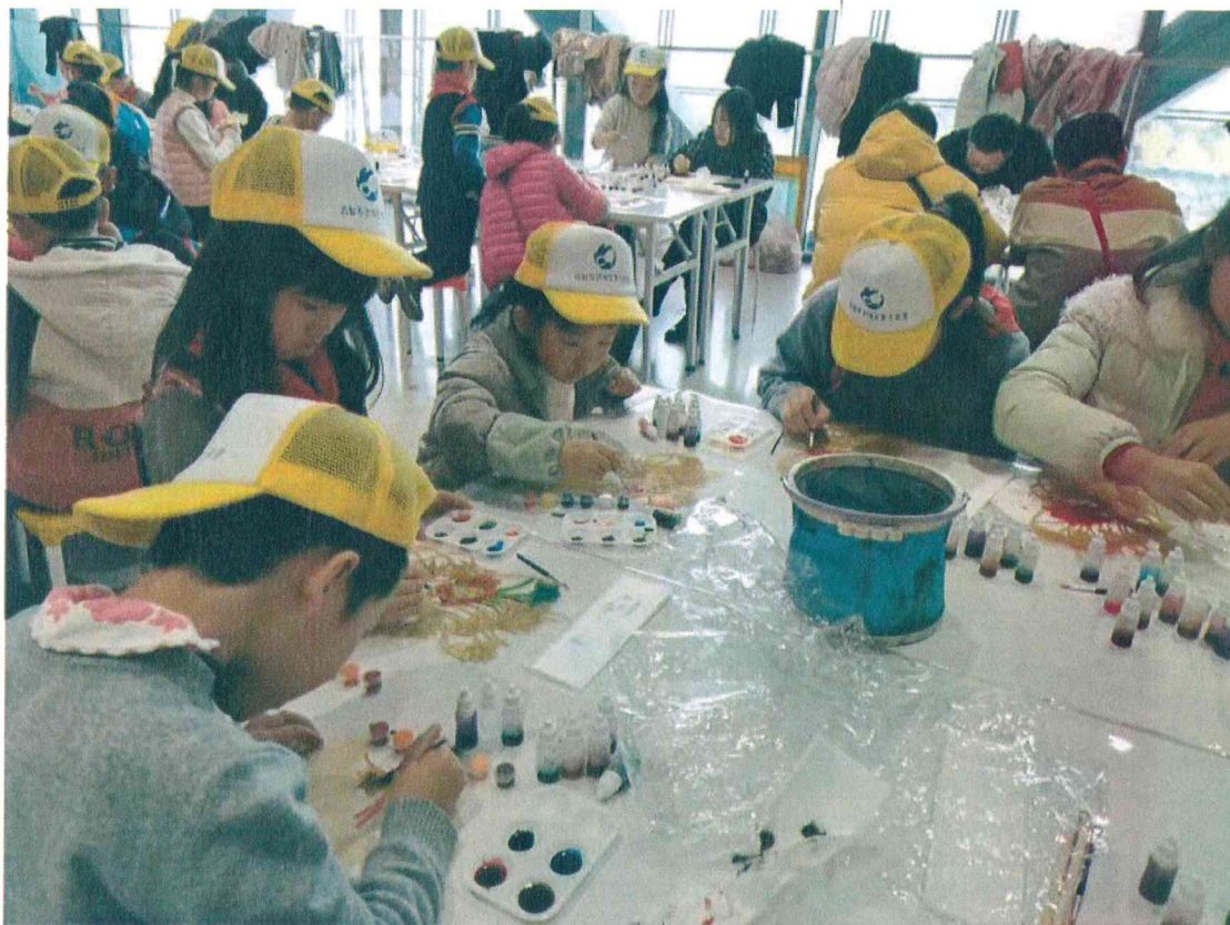
2019年 青少年宫小朋友参加皮影上色手工坊活动