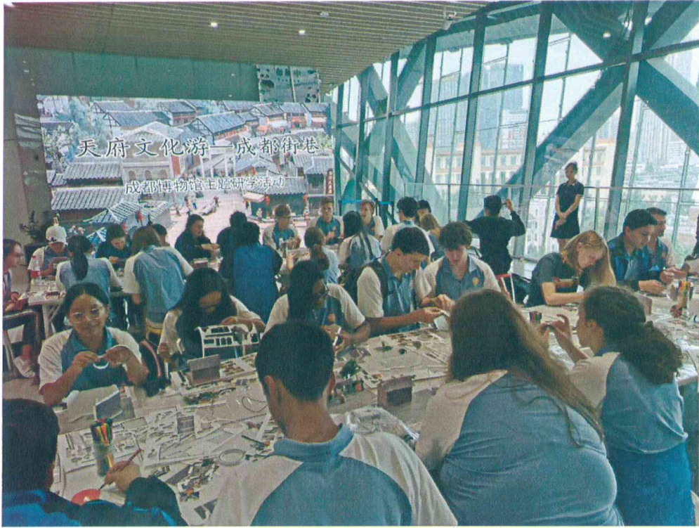
2019年 老成都民俗街巷纸模——成都民俗文化主题学生团队研学活动