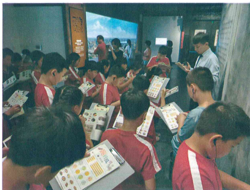
2019 年 趣行成博——成都博物馆青少年知识导览主题学生团队研学活动