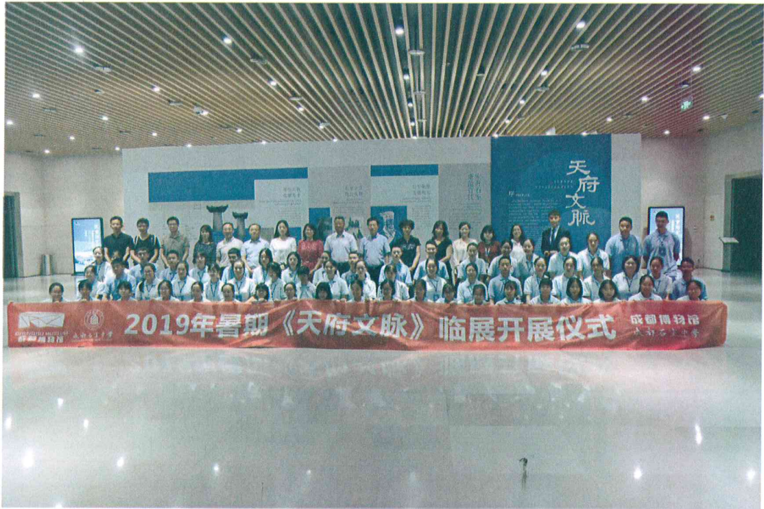
2019年暑期 “天府文脉” 临展开幕式