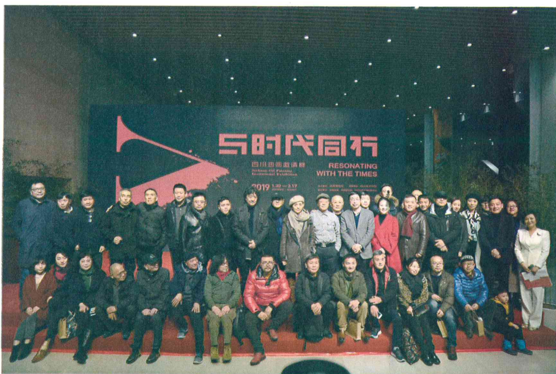
2019年1月29日 “与时代同行—四川油画邀请展”开幕式

做好基本陈列日常管理同时，举办“双城记—成都与宜宾”“与时代同行—四川油画邀请展”“食为天—餐桌上的文化之旅”“成都熊猫亚洲美食节举办的系列展览”“万物熙攘：第54届全球野生动物摄影展”“巧手夺天工—传统工艺的现代新生”“走进重华宫”等临展、特展超过10项，积极推动多领域跨界融合创新。