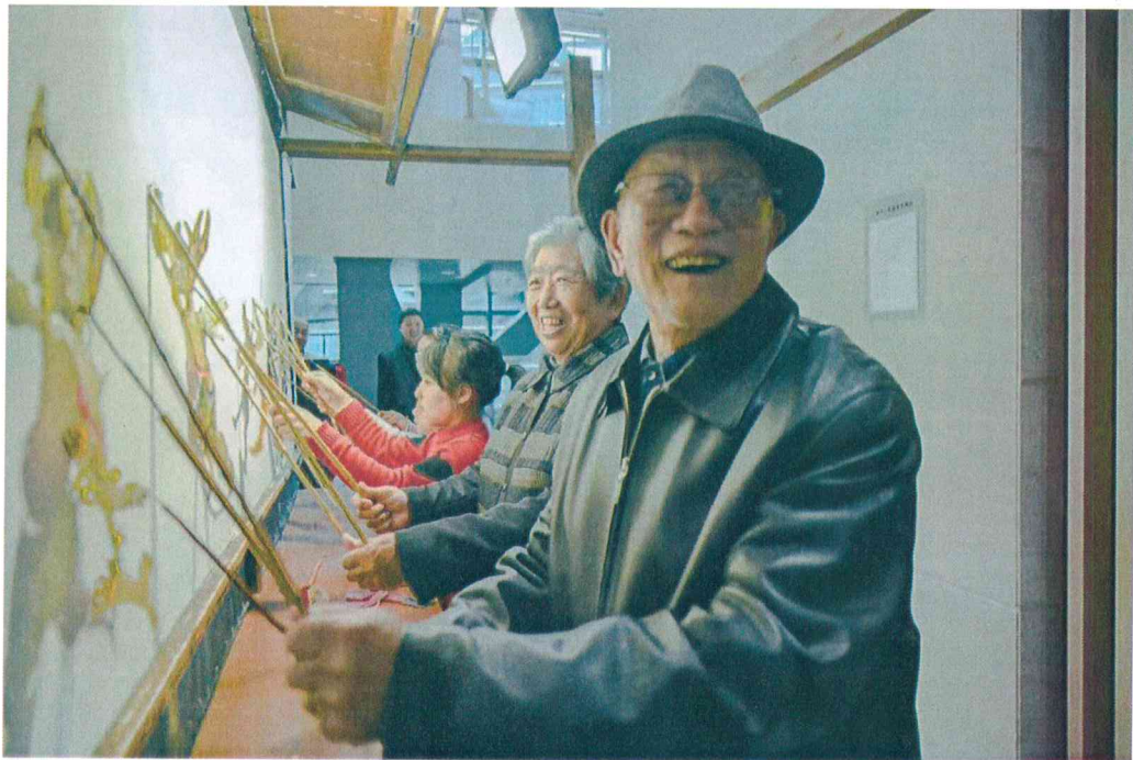
2019年 90岁老人在成都博物馆参加皮影操纵体验活动