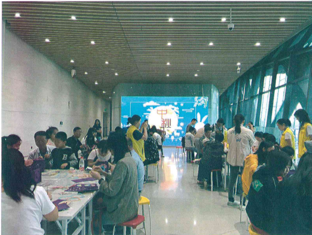
2019年 花灯话中秋——中秋节文化主题活动