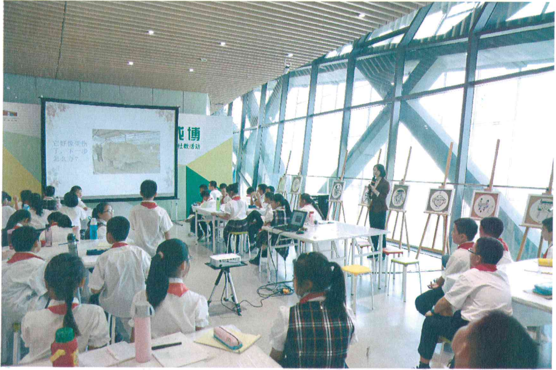
2019年 水与成都——石犀主题学生团队研学活动