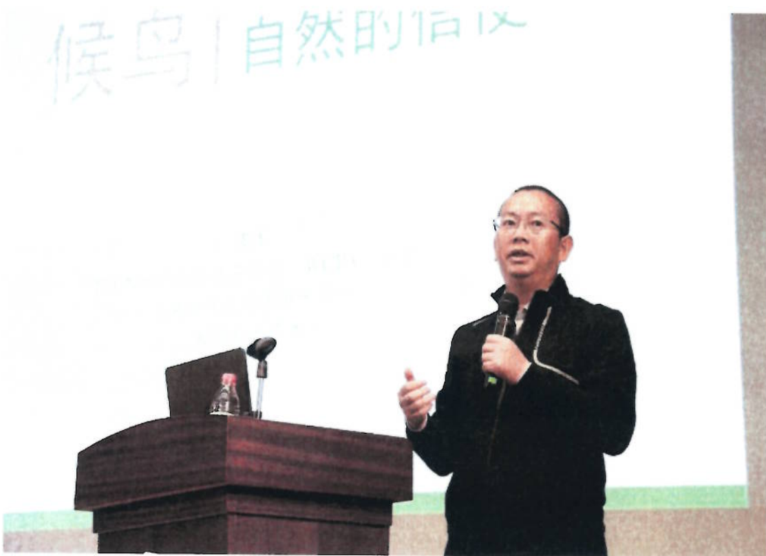
2018年10月20日 《候鸟，自然的信使》讲座