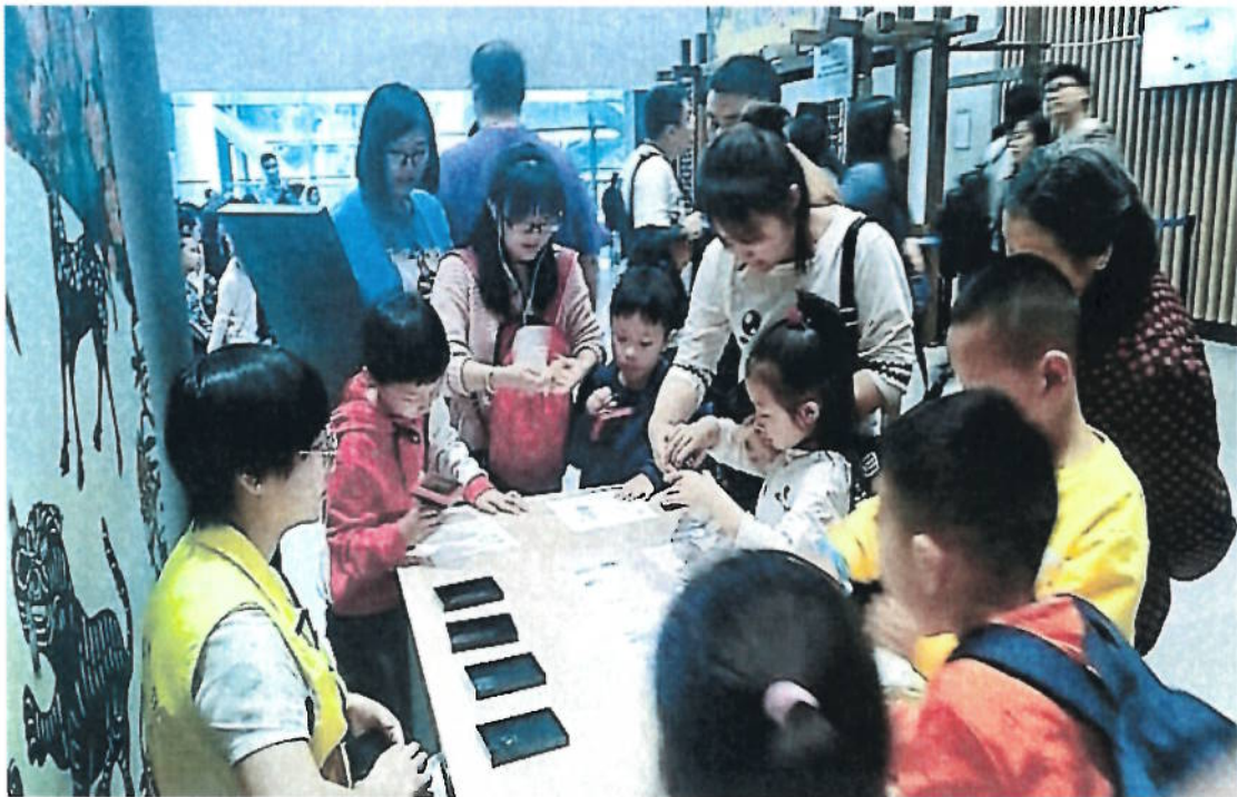
2018年 观众在成都博物参加皮影盖章集印活动