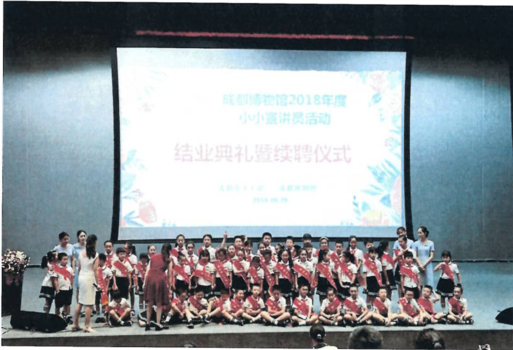
2018 年 8 月 28 日 小小宣讲员活动

余场；微信用户量超过 67 万人，语音导览播放量超过 1158 万次；推出“馆长/策展人讲解日”活动 16 场。