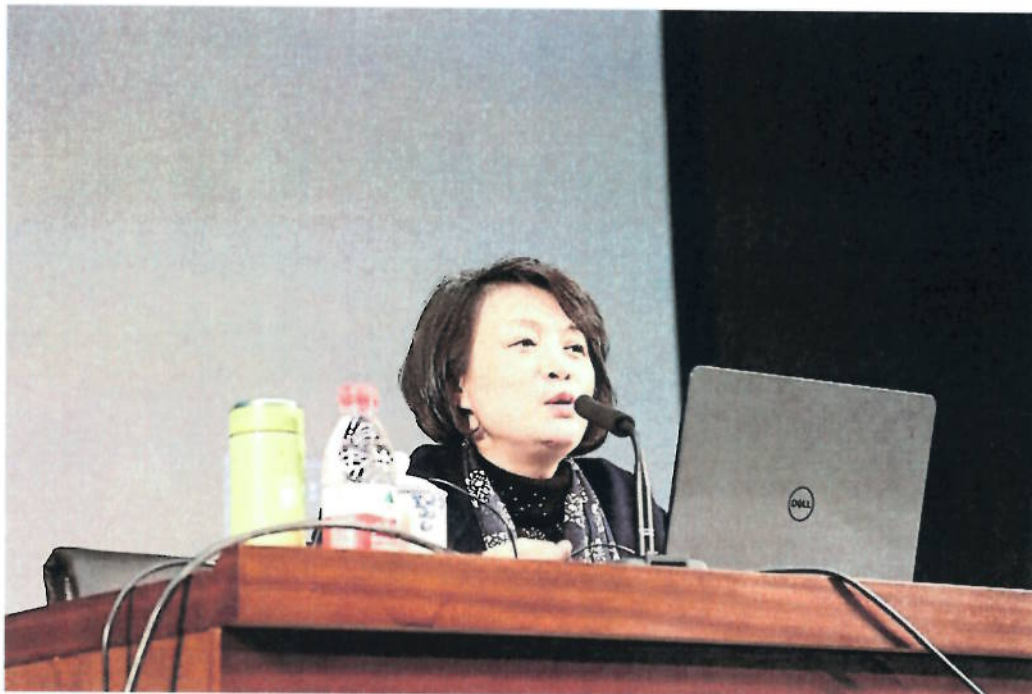
2018年3月3日 《蜀锦传承与发展的当代实践》讲座