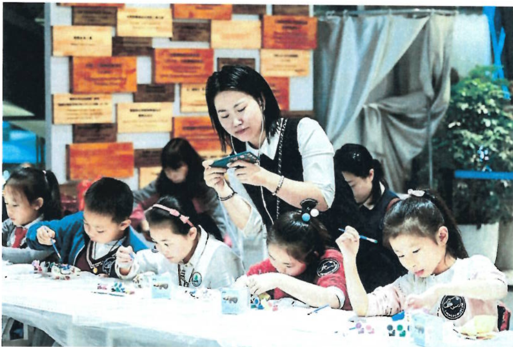
2018 年 石犀穿新衣——石犀主题活动