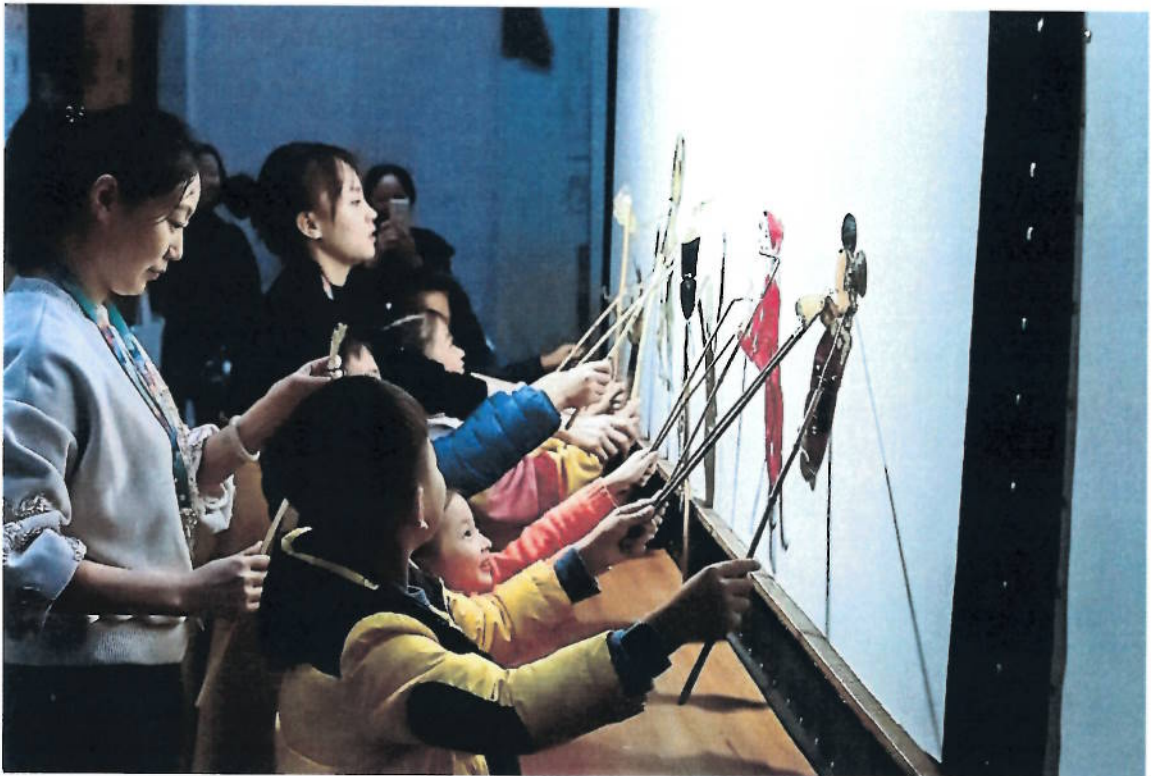
2018年 皮影操纵互动体验——皮影主题活动