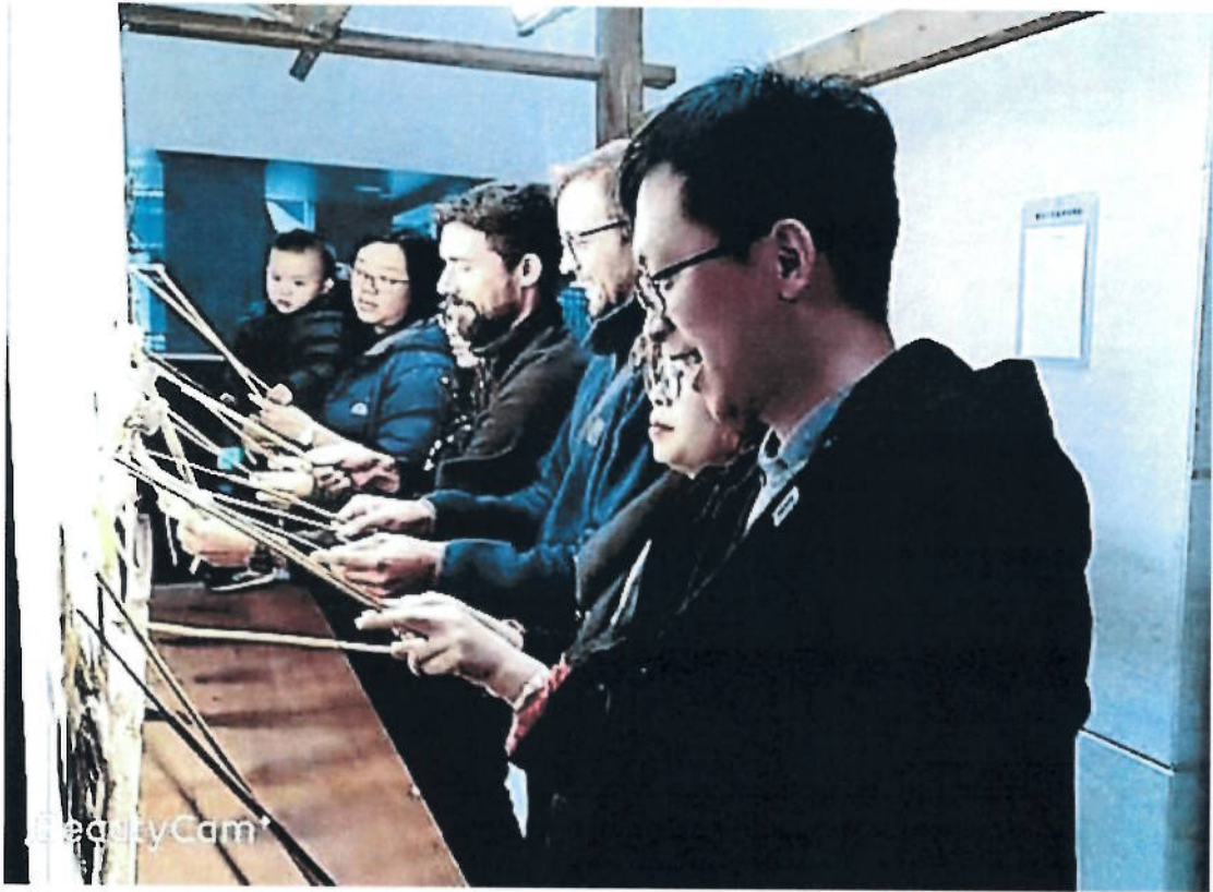
2018年 观众在成都博物馆参加皮影操纵体验活动