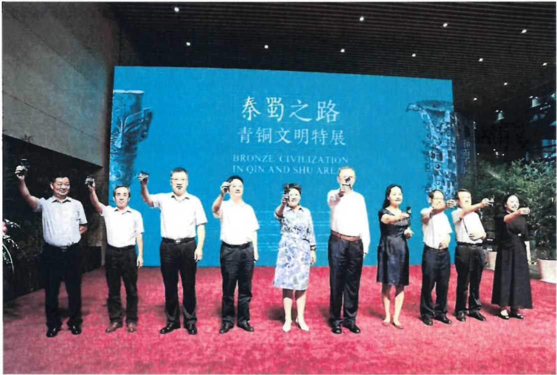
2018年8月6日 “秦蜀之路—青铜文明特展”开幕式