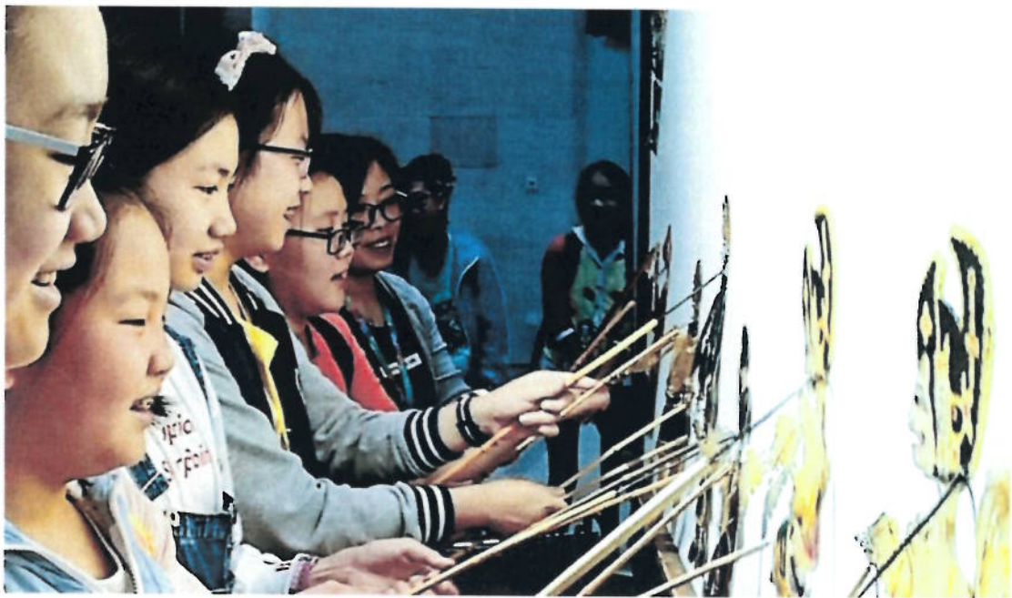
2018年 成都实验小学学生参加皮影操纵体验活动