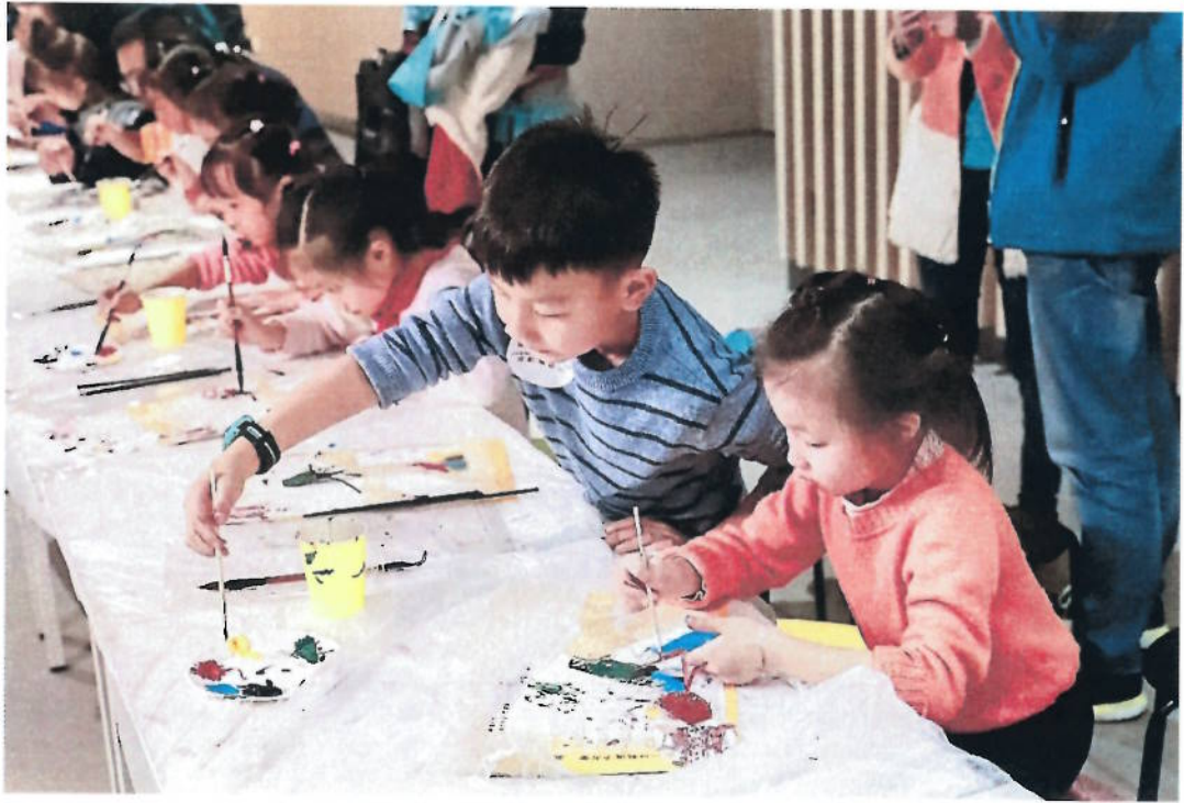
2018年 皮影敷彩——皮影主题活动