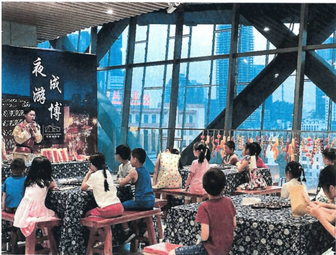
2018年 老成都民俗穿越游——夜游成博民俗篇主题活动