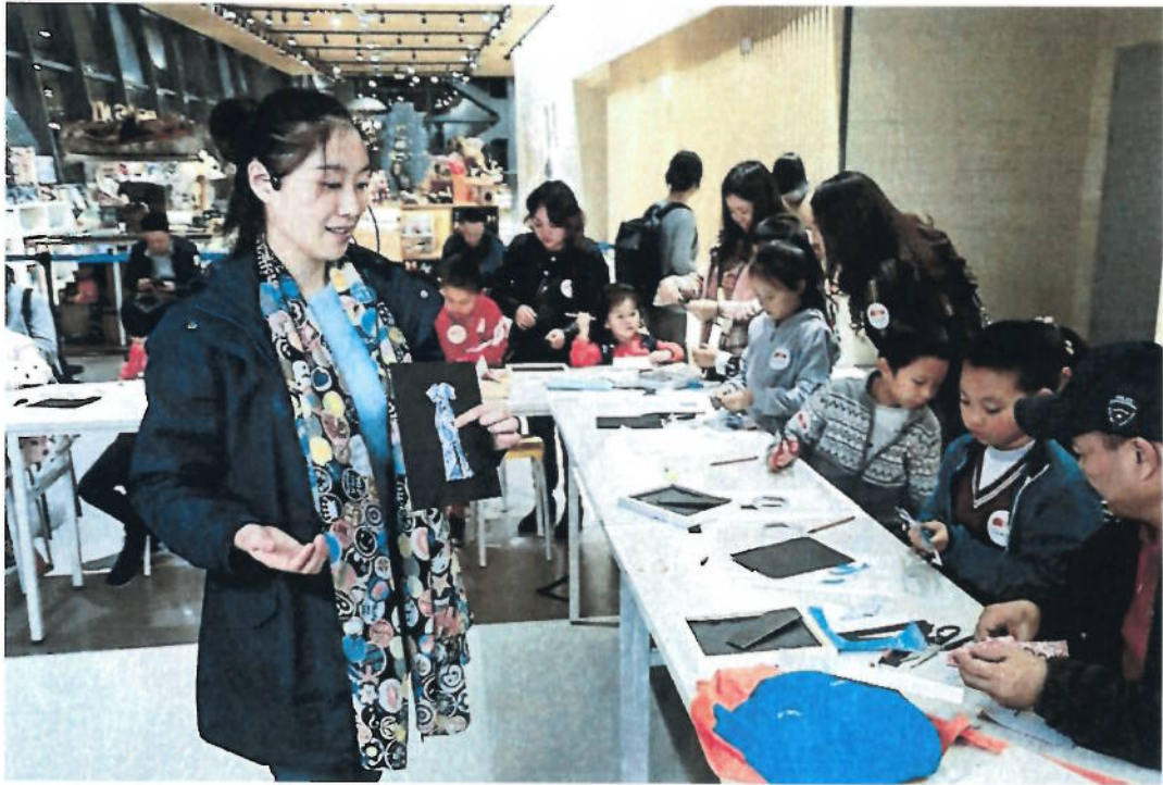
2018年 巧裁锦衣——蜀锦主题活动