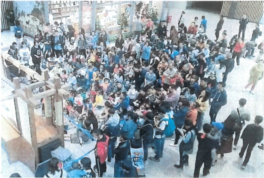
2018年 观众在成都博物馆观看皮影戏