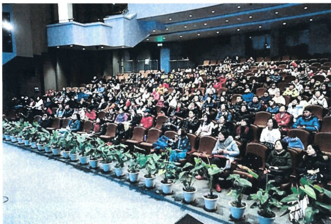
2018年1月27日 《锦城谈妙锦》讲座