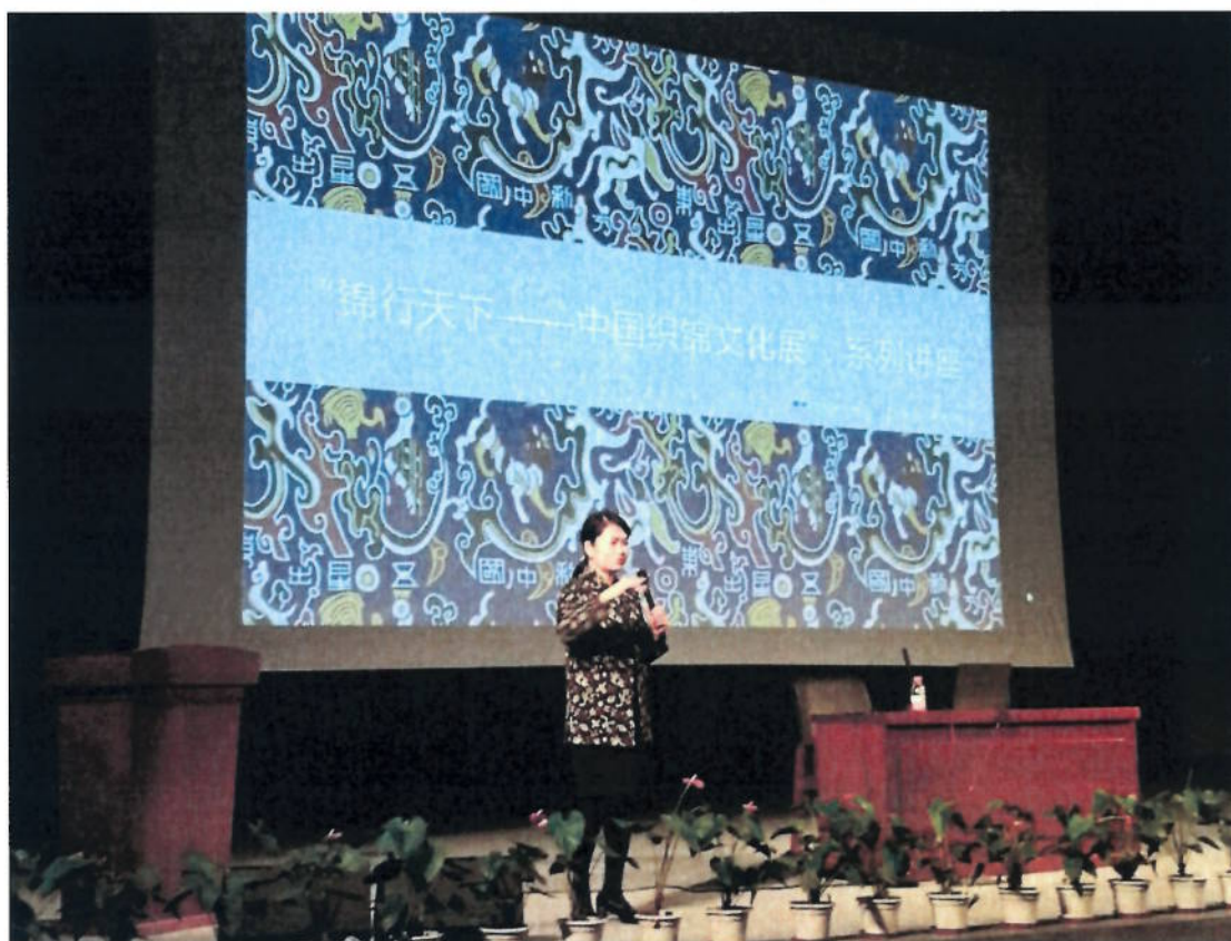
2018年1月20日 《丝路之绸的认知与保护》讲座