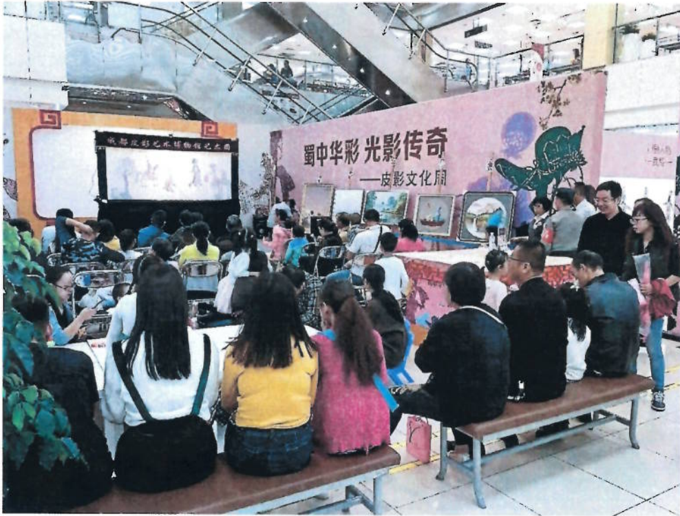
2018年10月国庆期间，成都博物馆与成都伊藤建设路店联合打造的“蜀中华彩 光影传奇”皮影文化周。