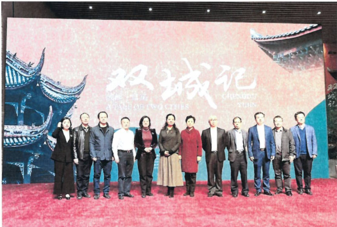
2018年11月10日 “双城记—成都·宜宾”展开幕式