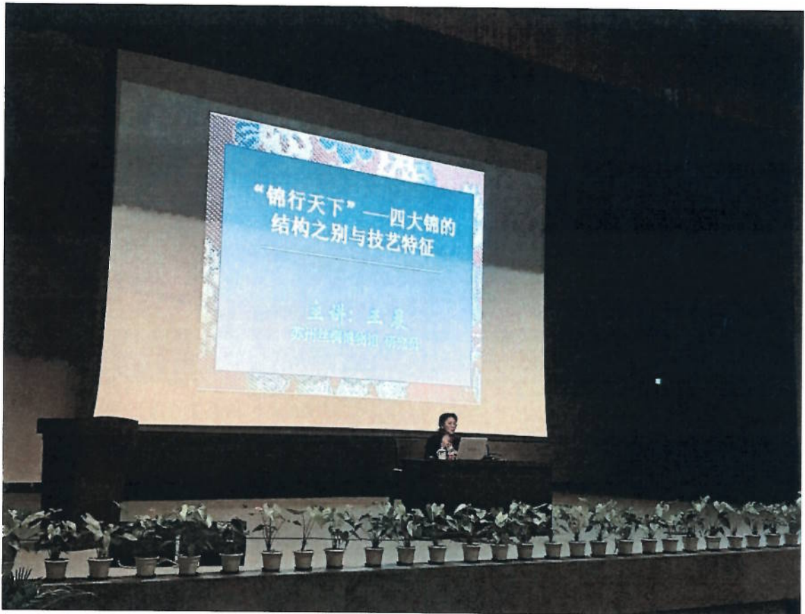
2018年3月3日 《四大锦的结构之别与技艺特征》讲座